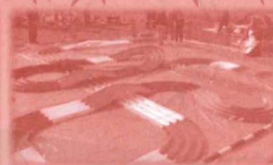
ミニ四駆レース ※10時と13時から受付開始