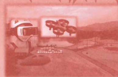
ドローンVR体験 VRでまるでドローンに乗っている 体験ができるよ!