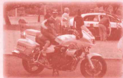
パトカーと白バイ展示 パトカーと白バイがやってくる