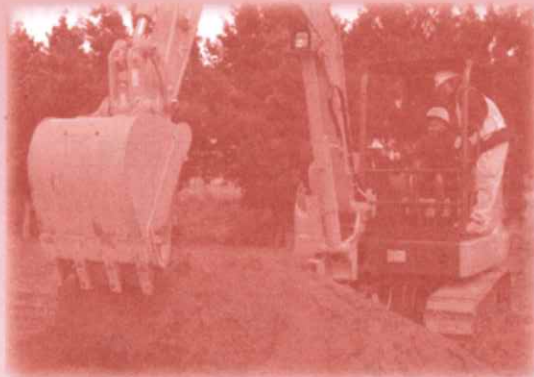
ショベルカー操縦体験 本物のショベルカーを動かそう 10時、13時受付開始 各回先着100名 ※小さなお子様は保護者の方と一緒に操縦できます