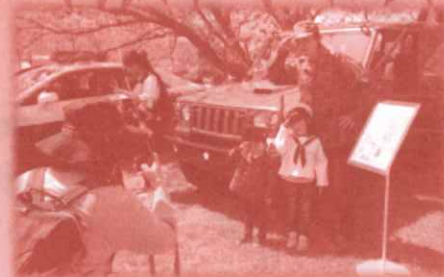
自衛隊の車で記念撮影 自衛隊使用車両が来るよ!