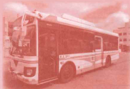
宇和島自動車の展示 運転席から見える眺めは最高!