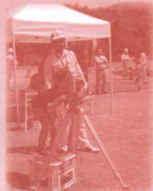
測量体験 距離を正確に測ろう!