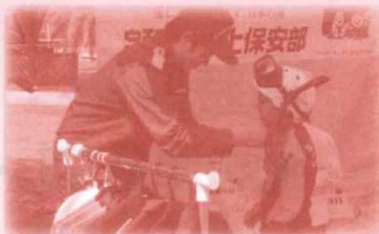
宇和島海上保安部 制服をカッコよく着こなそう!