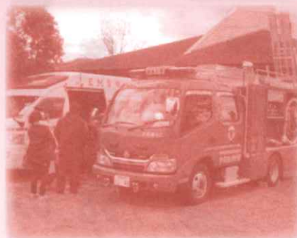
消防車と救急車の展示 消防車と救急車がやってくる こども用防火服もあるよ ※午前10時から12時まで